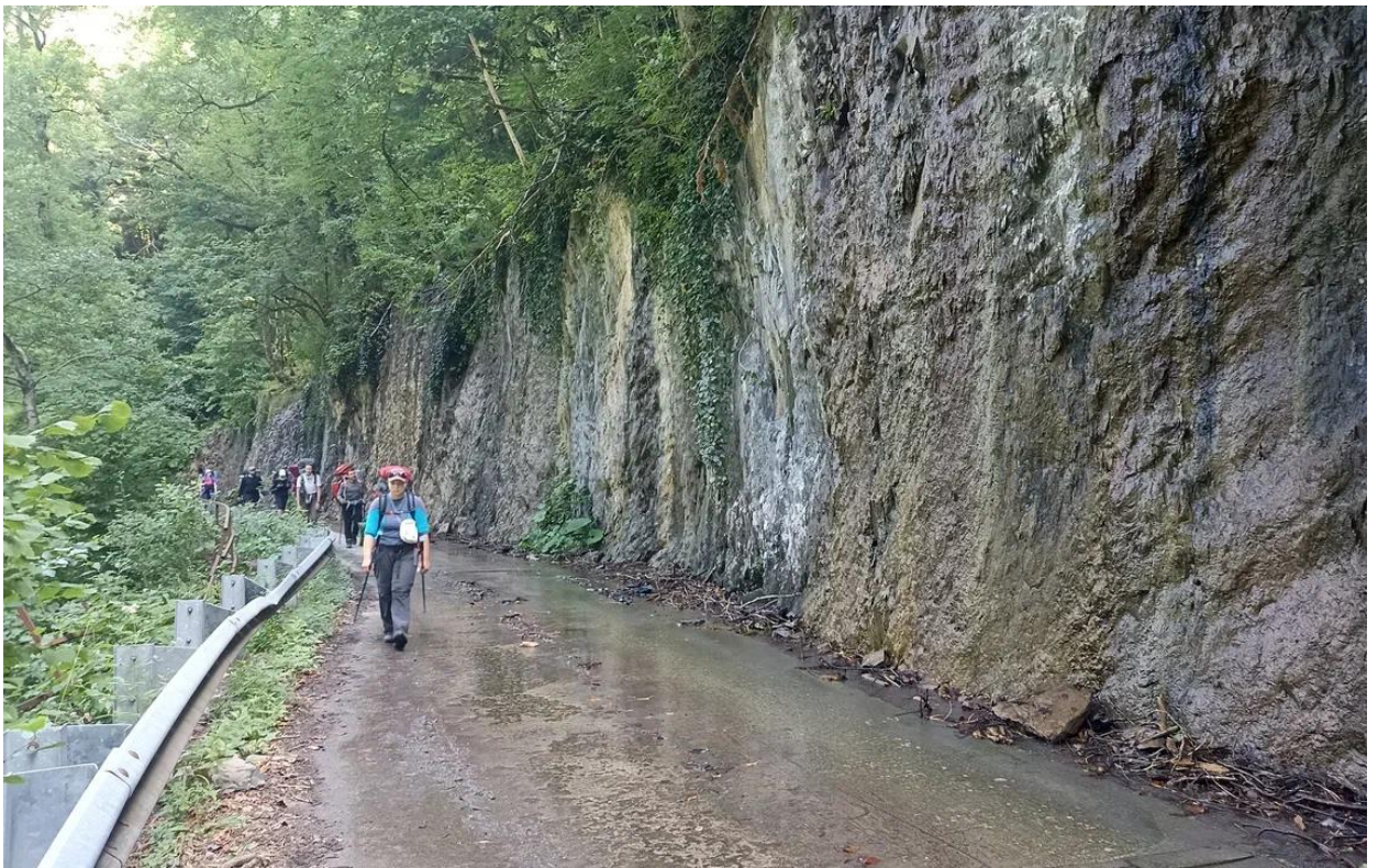
Мокрая дорога в Солохаул

И вот она конечная точка пешеходного маршрута. Завтра нас заберет наш транспорт, а пока отдыхать.