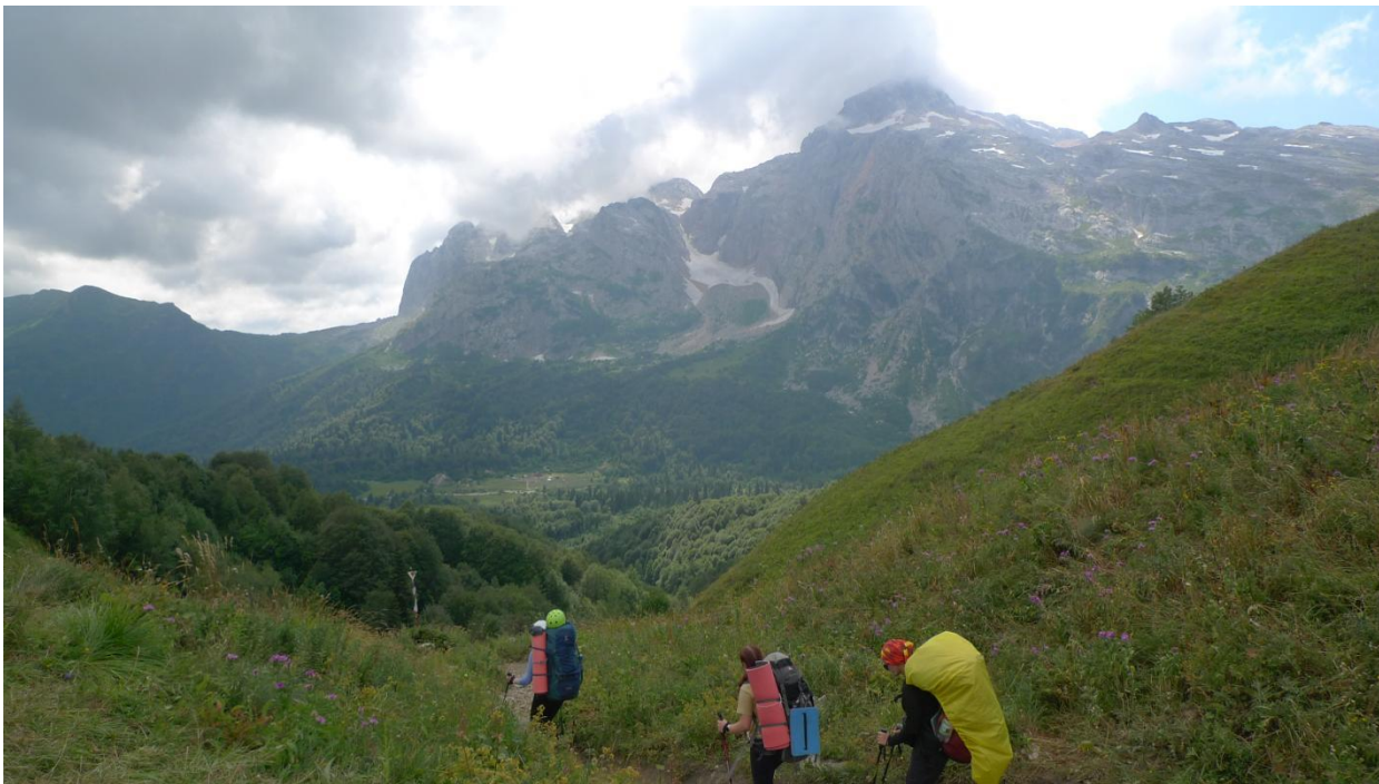
Вид с Армянского перевала