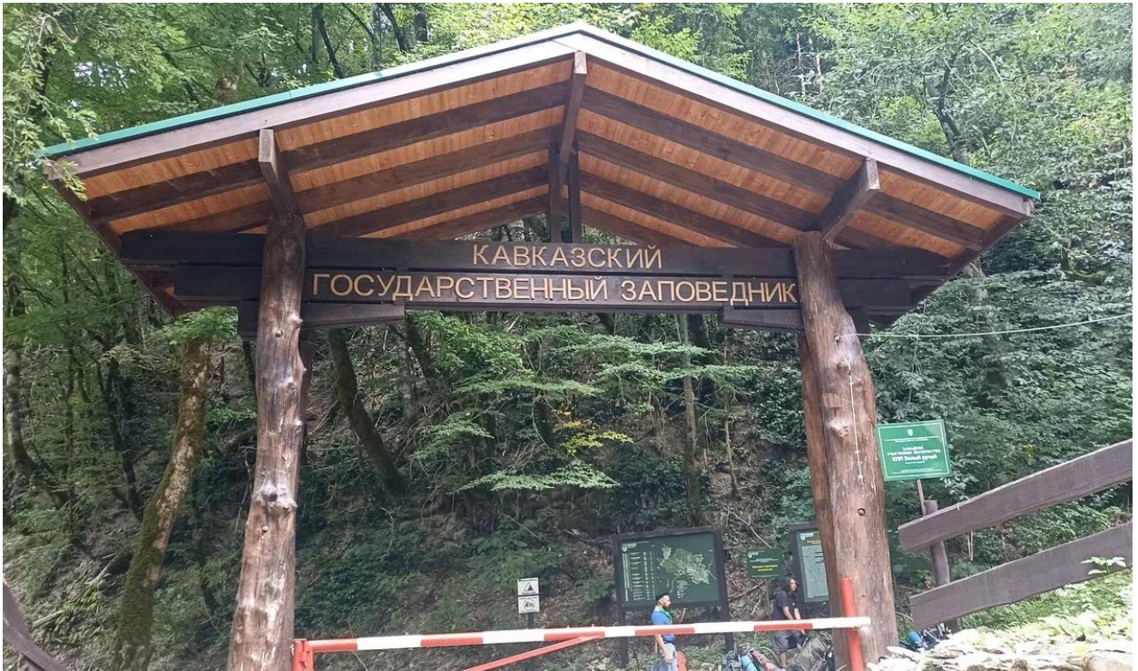
Выход из заповедника