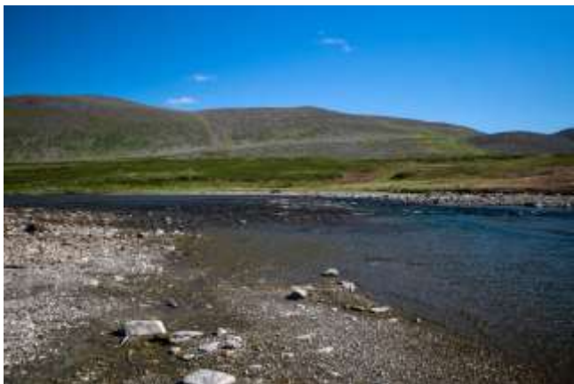
Рис.5 Брод реки Б. Уса

21.07. Обычная дорога-колея превратилась в колею для нарт оленеводов. По их колее группа подошла к реке Большая Уса, перешла её вброд (где-то поколени) и двигалась на перевал. В седловине организовали отдых и начали спуск в долину ручья Изъяшор. На ночлег остановились сразу же после перехода ручья вброд (67.469257, 65.791889).