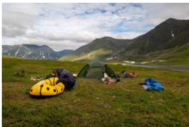
Рис.8 Сбор лодок

23.07. Полуднёвка. Собираем лодки и идём сначала по Малой Хадате, затем, через пролив, попадаем в озеро Большая Хадата. Доходим до водопада (67.603488, 66.020288).