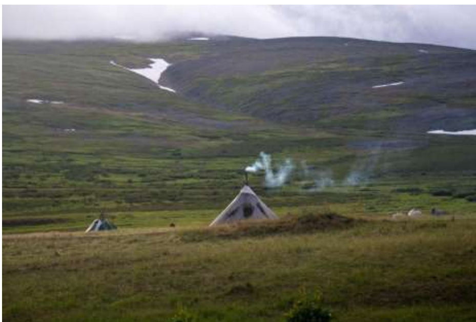
Рис.14 По дороге на реку Немуръеган, стоянка оленеводов

26.07. Утром пошли вниз с перевала к месту начала сплава по рекам Немуръеган и Лонготъеган. Встали на ночлег после брода через реку Немуръеган (67.400176, 66.50498).