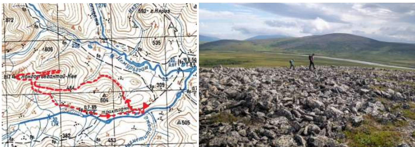
Рис.15 Радиальный выход на г. Лонготъёгантай-Кев (817м)

28.07. Радиальный выход на г. Лонготъёгантай-Кев (817м). Ранний подъем, группа вышла в сторону горы по попутным дорогам болотоходов, по пути пересекая высокотравье, кустарник и курумники. По возвращению в лагерь начали собирать лодки и катамаран для сплава по рекам Лонготъеган и Немуръеган.