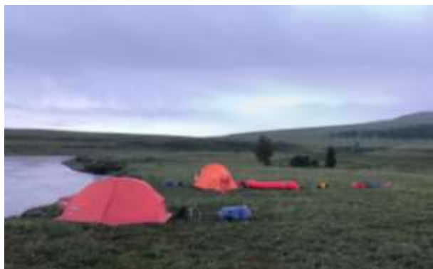
Рис.20 Лагерь на впадении ручья Харчерузь

30.07. Утром и до ночи дожди с грозами продолжились, пришедший холодный фронт с севера был с сильными порывами ветра и не прекращающимся дождем. В этот день никуда не выходили. Пробовали рыбачить в короткие затишья, но безуспешно. Уровень воды в Лонготе поднялся почти на метр, а ручей Харчерузь из маленького ручейка превратился в большой грязевой поток.