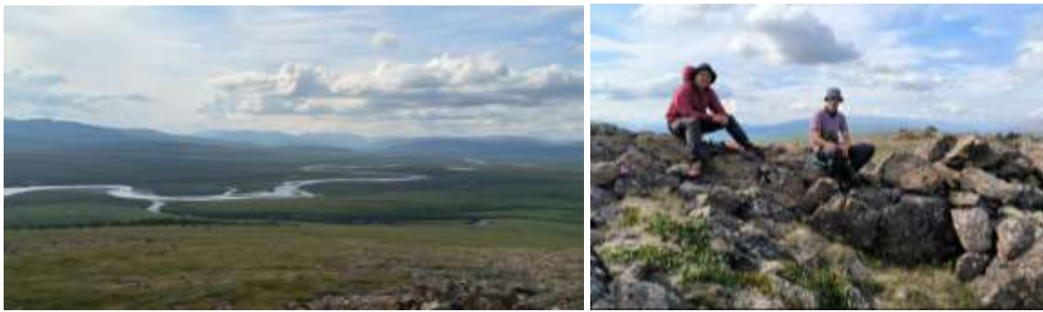
Рис.24 Вид на реку Лонготъеган с хребта Харчерузь

01.08. Утром быстро собрались, вышли на сплав по реке Лонгот. По пути встретили стоянку знакомых нам оленеводов. Далее по реке препятствий не было, только небольшие перекаты, течение хорошее. К обеду прошли около 20 км, вышли на равнинную часть реки. Далее река стала спокойно, практически без течения, петлять по бескрайней тундре, к вечеру дошли до автомобильного моста, за день было пройдено по воде более 40 км. На ночлег встали на левом берегу, в двух километрах ниже моста, на высоком холме. Вечером по спутниковому телефону созвонились с организаторами нашей выброски, выяснили, что наш транспорт где то в тундре и будет только через два дня. И еще определяющий неприятный момент, что точкой нашей выброски организаторы посчитали малый водопадный порог, а не большой, как мы планировали. Смысла идти 20 км до большого водопада не было, с учетом неясности нашей дальнейшей выброски.