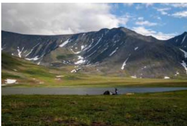
Рис.9 Озеро Малая Хадата

23.07. Полуднёвка. Собираем лодки и идём сначала по Малой Хадате, затем, через пролив, попадаем в озеро Большая Хадата. Доходим до водопада (67.603488, 66.020288).