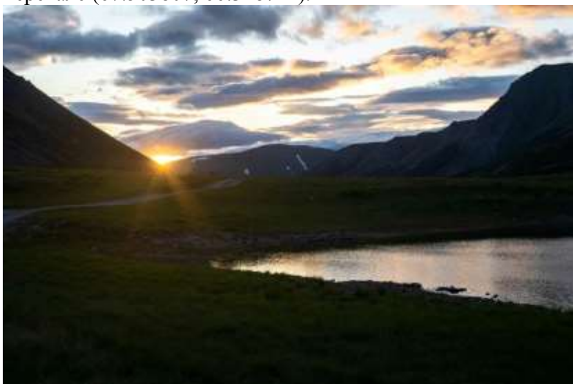
Рис.13 Вечер на перевале

25.07. Утром двигались на лодках по реке Хадата до вездеходного брода около 10 км. Затем собрали лодки и пошли пешком по вездеходной дороге на перевал. На ночлег встали у озера на перевале (67.503807, 66.328721).