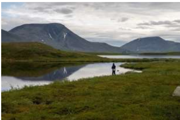
Рис.7 Рыбалка на оз. М.Хадата

22.07. Ранний подъем, сегодня должны дойти до озера малое Хадата-Юган-Лор. В этой долине дороги только для нарт оленеводов, а им чем мокрее, тем лучше. Весь день шли по верховым болотам водораздела между ручьём Изъяшор и озера Малая Хадата. Периодически лил дождь. Температура около +12. К вечеру дошли до озера Малая Хадата (67.588343, 65.907051).