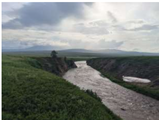
Рис.22 Каньон ручья Харчерузь

31.07. Сутра дожди стали редкими и несильными, ближе к обеду появилось солнце. Ландшафт русла реки Лонгот сильно изменился, плесы были затоплены, перекаты исчезли, вода была темно-мутного цвета, рыбалка с этого дня практически закончилась. В 11:00 собрались в радиальный выход на хребет Харчерузь. От лагеря сначала прошли вдоль каньона ручья Харчерузь, затем через болотистую поляну начали набирать высоту в сторону хребта. Наверху организовали фотосъемку и обед. Пообедав, спустились напрямую к впадению ручья. Вечером наблюдали как оленеводы перегоняют стадо, переходя ручей. Пообщались, обменялись контактами.