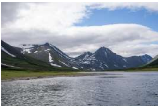
Рис.11 Озеро Большая Хадата

24.07. Радиальный выход на водопад. После обеда вышли по воде к началу реки Хадата, встали на ночлег (67.603843, 66.07571).