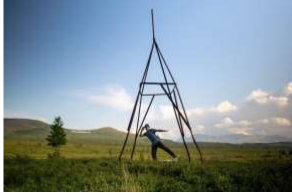
Рис.1 День первый, дорога вдоль р. Малая Пайпудына

19.07. Двигались весь день по дороге вдоль реки. Поднимались вверх к водоразделу. Встали у брода через Большую Пайпудыну (67.252294, 65.726227).