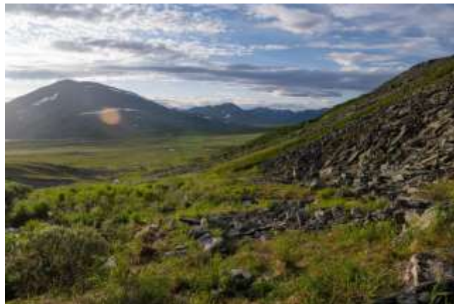
Рис.6 Спуск в долину ручья Изъяшор

22.07. Ранний подъем, сегодня должны дойти до озера малое Хадата-Юган-Лор. В этой долине дороги только для нарт оленеводов, а им чем мокрее, тем лучше. Весь день шли по верховым болотам водораздела между ручьём Изъяшор и озера Малая Хадата. Периодически лил дождь. Температура около +12. К вечеру дошли до озера Малая Хадата (67.588343, 65.907051).