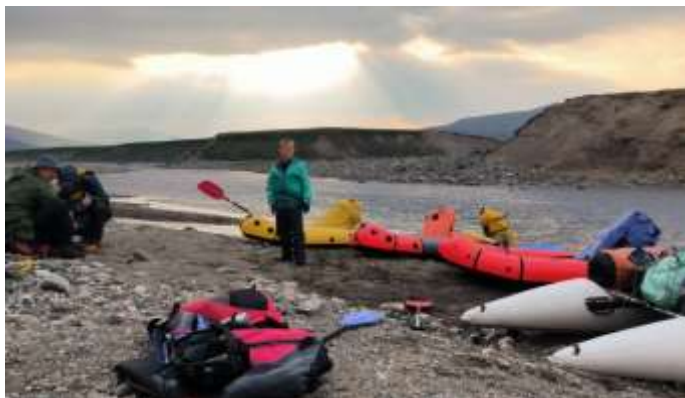
Рис.19 Обед на слиянии рек Лонгот и Немур

30.07. Утром и до ночи дожди с грозами продолжились, пришедший холодный фронт с севера был с сильными порывами ветра и не прекращающимся дождем. В этот день никуда не выходили. Пробовали рыбачить в короткие затишья, но безуспешно. Уровень воды в Лонготе поднялся почти на метр, а ручей Харчерузь из маленького ручейка превратился в большой грязевой поток.