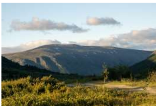
Рис.12 Дорога на перевал

25.07. Утром двигались на лодках по реке Хадата до вездеходного брода около 10 км. Затем собрали лодки и пошли пешком по вездеходной дороге на перевал. На ночлег встали у озера на перевале (67.503807, 66.328721).