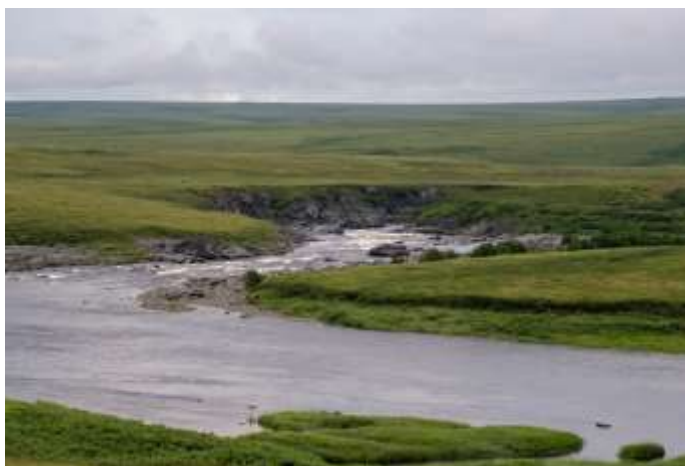
Рис.26 Заход в каньон малого водопадного порога

02.08. Сутра решили сходить в разведку на каньон малого водопадного порога, собрались, вышли по болотистой тундре. По пути было много ручьев и заболоченных мест. На каньоне устроили обед. Осмотрев каньон, решили, что из-за высокого уровня воды и мощности препятствий, пакрафты порог не пройдут. Идти одним катамараном тоже смысла не было, т.к. терялась перспектива выброски на попутном транспорте от автомобильного моста, а разница в цене в итоге получилась ощутимая. Плюс выходила экономия двух дней по маршруту.