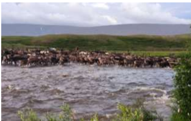
Рис. 21. Переход стада оленей через ручей

31.07. Сутра дожди стали редкими и несильными, ближе к обеду появилось солнце. Ландшафт русла реки Лонгот сильно изменился, плесы были затоплены, перекаты исчезли, вода была темно-мутного цвета, рыбалка с этого дня практически закончилась. В 11:00 собрались в радиальный выход на хребет Харчерузь. От лагеря сначала прошли вдоль каньона ручья Харчерузь, затем через болотистую поляну начали набирать высоту в сторону хребта. Наверху организовали фотосъемку и обед. Пообедав, спустились напрямую к впадению ручья. Вечером наблюдали как оленеводы перегоняют стадо, переходя ручей. Пообщались, обменялись контактами.