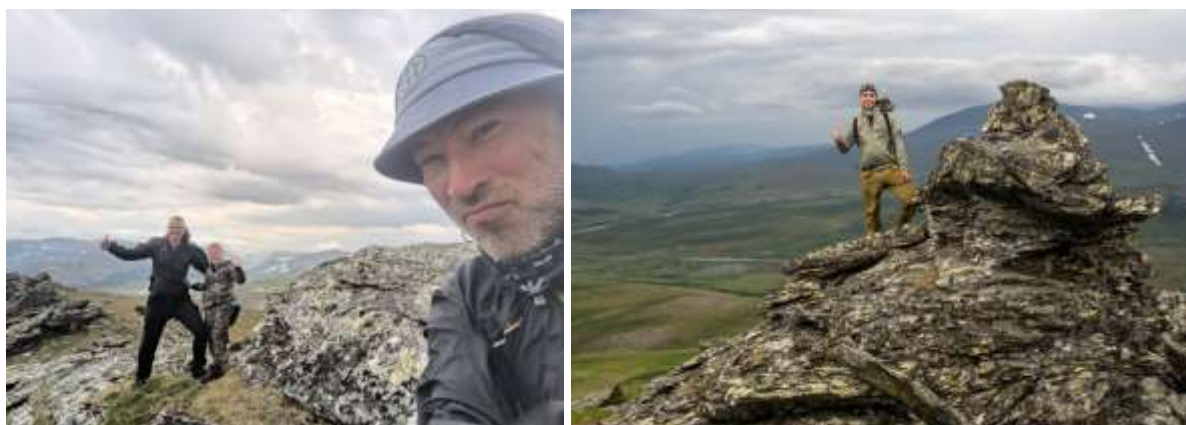
Рис.16 Группа на г. Лонготъёгантай-Кев