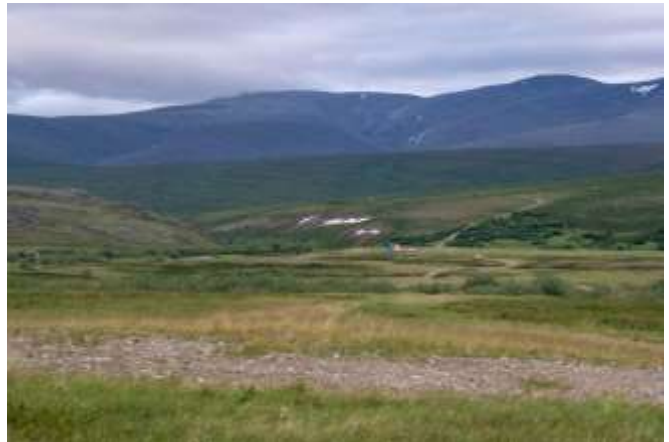
Рис.2 День второй, дорога вдоль р. Б.Пайпудына

20.07. Дорога ушла через брод на восток. Двигались весь день практически по горной тундре. Иногда встречались попутные дороги. После обеда на озере Рыбное нашли нужную дорогу и подошли к водоразделу между реками Большой Пайпудыной и Большой Усой. Встали на ручье Охотничьем (67.358193, 65.815422).