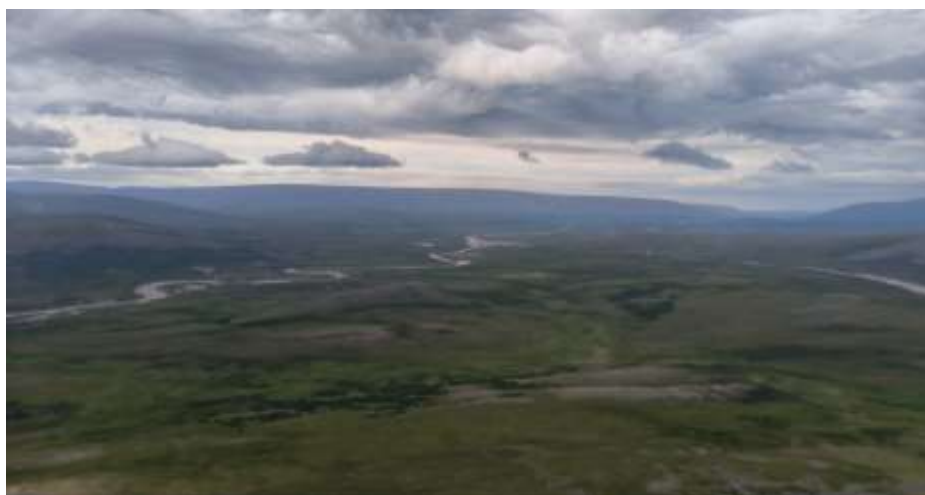
Рис.17 Вид с г. Лонготъёгантай-Кев на слияние рек Немур и Лонгот.

29.07. Утром до собирали лодки упаковали вещи для сплава по рекам. В 11:00 вышли на сплав. Воды в реках было критически мало, до слияния Немура с Лонготом был практически волок. Порог на Лонготе до слияния в небольшом каньоне представлял собой шиверу 2 к.т. в скальном сужении берегов. Русло разбивалось на несколько протоков крупными обломками скал, проходы между которыми едва позволяли протиснуть катамаран. Прошли всеми судами, со взаимной страховкой. На слиянии рек Немуръеган и Лонготъеган встали на обед. Далее река Лонгот становится шире и глубже, перекаты более мощными, отмелей становится мало. К вечеру