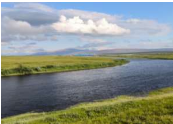
Рис. 25 Вид с места стоянки на а/м мост

01.08. Утром быстро собрались, вышли на сплав по реке Лонгот. По пути встретили стоянку знакомых нам оленеводов. Далее по реке препятствий не было, только небольшие перекаты, течение хорошее. К обеду прошли около 20 км, вышли на равнинную часть реки. Далее река стала спокойно, практически без течения, петлять по бескрайней тундре, к вечеру дошли до автомобильного моста, за день было пройдено по воде более 40 км. На ночлег встали на левом берегу, в двух километрах ниже моста, на высоком холме. Вечером по спутниковому телефону созвонились с организаторами нашей выброски, выяснили, что наш транспорт где то в тундре и будет только через два дня. И еще определяющий неприятный момент, что точкой нашей выброски организаторы посчитали малый водопадный порог, а не большой, как мы планировали. Смысла идти 20 км до большого водопада не было, с учетом неясности нашей дальнейшей выброски.