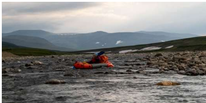
Рис.18 Сплав(волок) по р Лонготъёган до слияния

дошли до впадения ручья Харчерузь, лагерь поставили на высоком левом берегу после впадения ручья. Ночью началась мощная гроза.